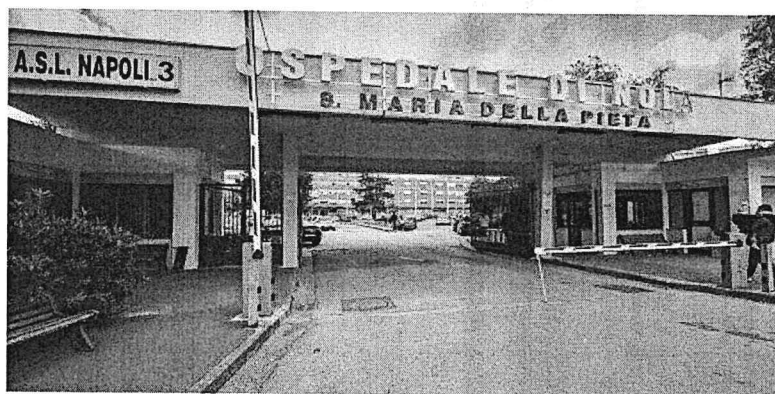
P.O. Santa Maria della Pietà - Via delle Repubbliche, 7 - 80035 Nola (NA)

Il P.O. di Nola è dotato di 2 Blocchi Operatori, ciascuno con 2 sale, ubicati uno al 1° piano ed uno al 3° piano dell'Ospedale, collegati tra di loro da un ascensore interno. Il blocco operatorio del III piano è dedicato all'attività chirurgica di elezione, mentre il blocco operatorio del I piano è dedicato all'attività chirurgica in urgenza con una sala dedicata all'ostetricia.