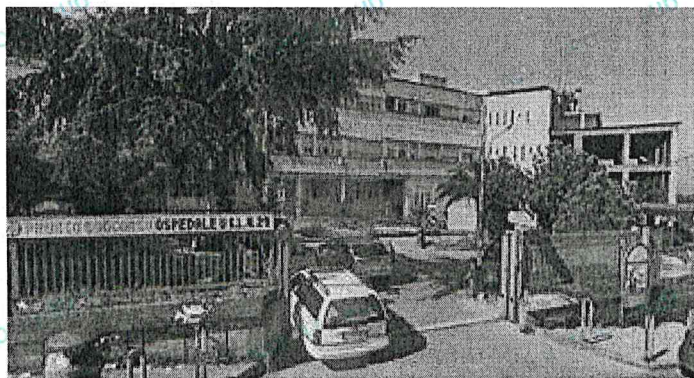
Ospedale Cav. Raffaele Apicella, Via Massa, 1 – 80040 Pollena Trocchia (NA)

Il Reparto di Terapia Intensiva, con attivi 7 posti letto, è ubicato al 1° piano, contiguo al Blocco Operatorio dedicato all'attività chirurgica in urgenza.